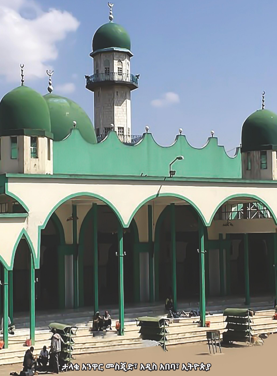
ታላቁ አንጻር ሙስጂድ፣ አዲስ አበባ፣ ኢትዮጵያ