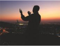
አላህን (እውነተኛውን አምላክ) የሚማፀን ሙስሊም