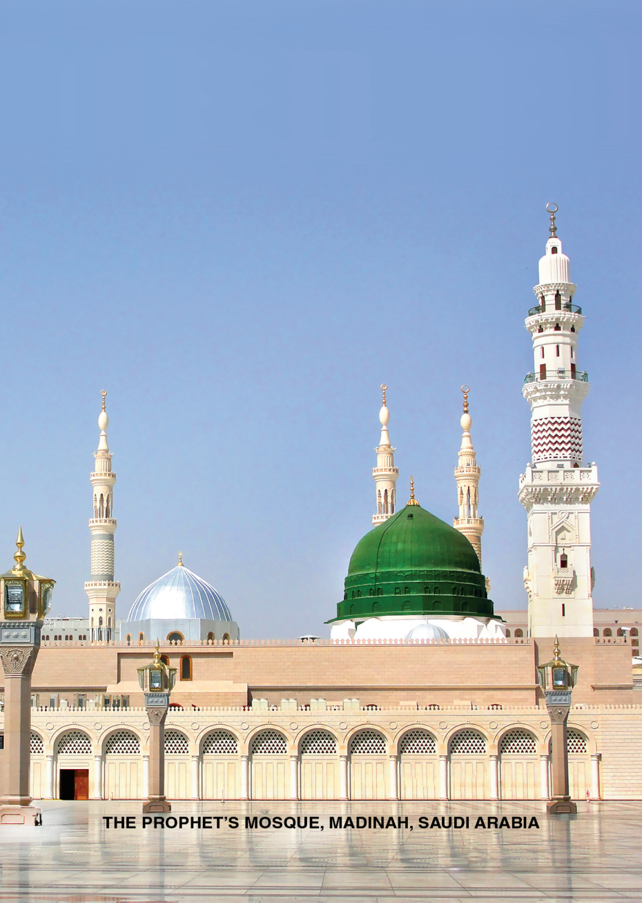
THE PROPHET'S MOSQUE, MADINAH, SAUDI ARABIA