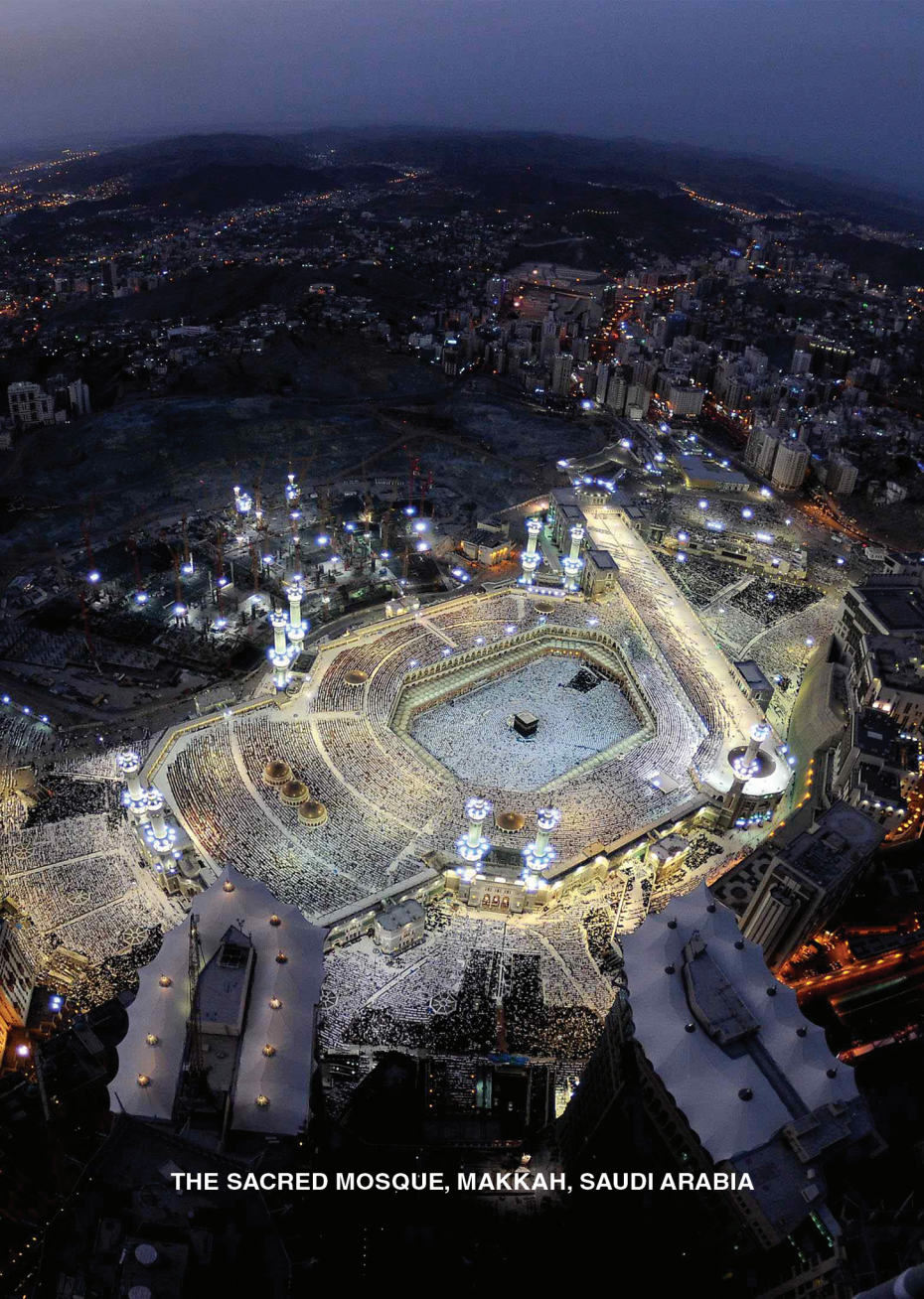
THE SACRED MOSQUE, MAKKAH, SAUDI ARABIA