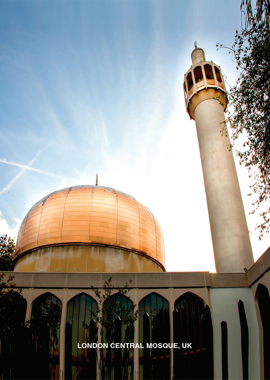
LONDON CENTRAL MOSQUE, UK