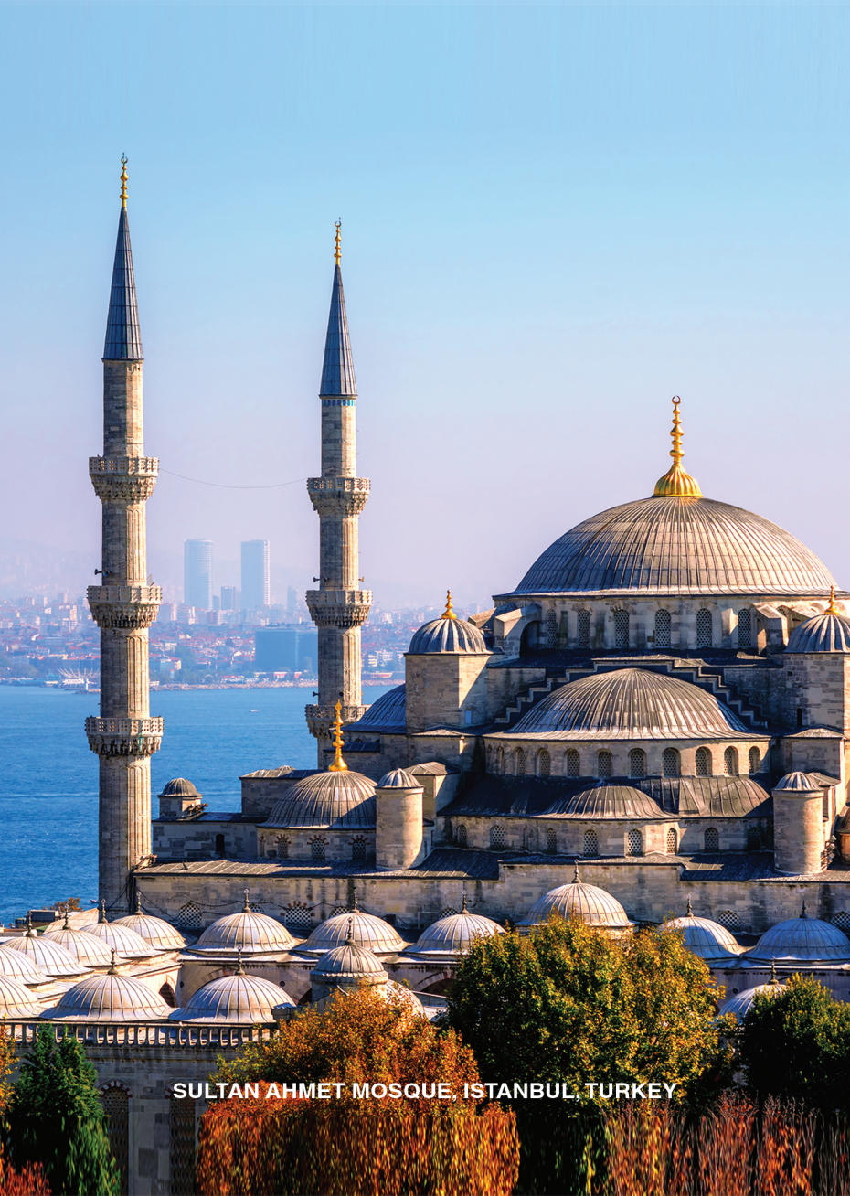
SULTAN AHMET MOSQUE, ISTANBUL, TURKEY