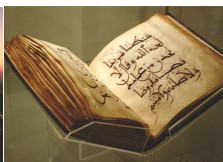
Den Heliga Koranen