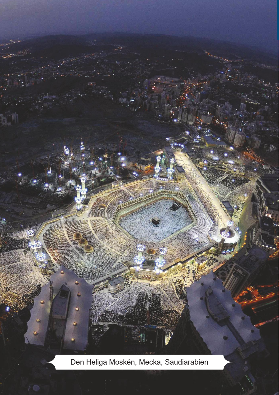
Den Heliga Moskén, Mecka, Saudiarabien