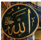
Allah na arapskom

Džamija: Čisto mesto za klanjanje koje muslimani koriste uglavnom za molitvu i bogoslužnje.