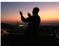
Musliman se moli Allahu