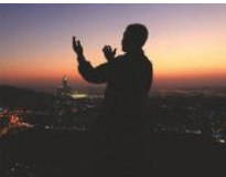
አላህን (እውነተኛውን አምላክ) የሚማፀን ሙስሊም