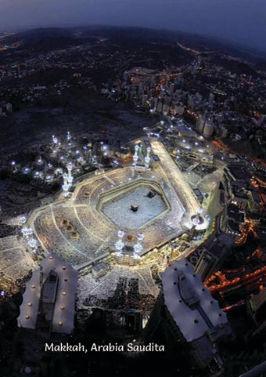
Makkah, Arabia Saudita