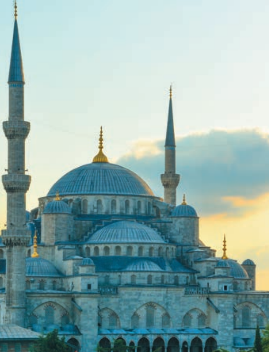
Mezquita del Sultán Ahmed | Estambul, Turquía