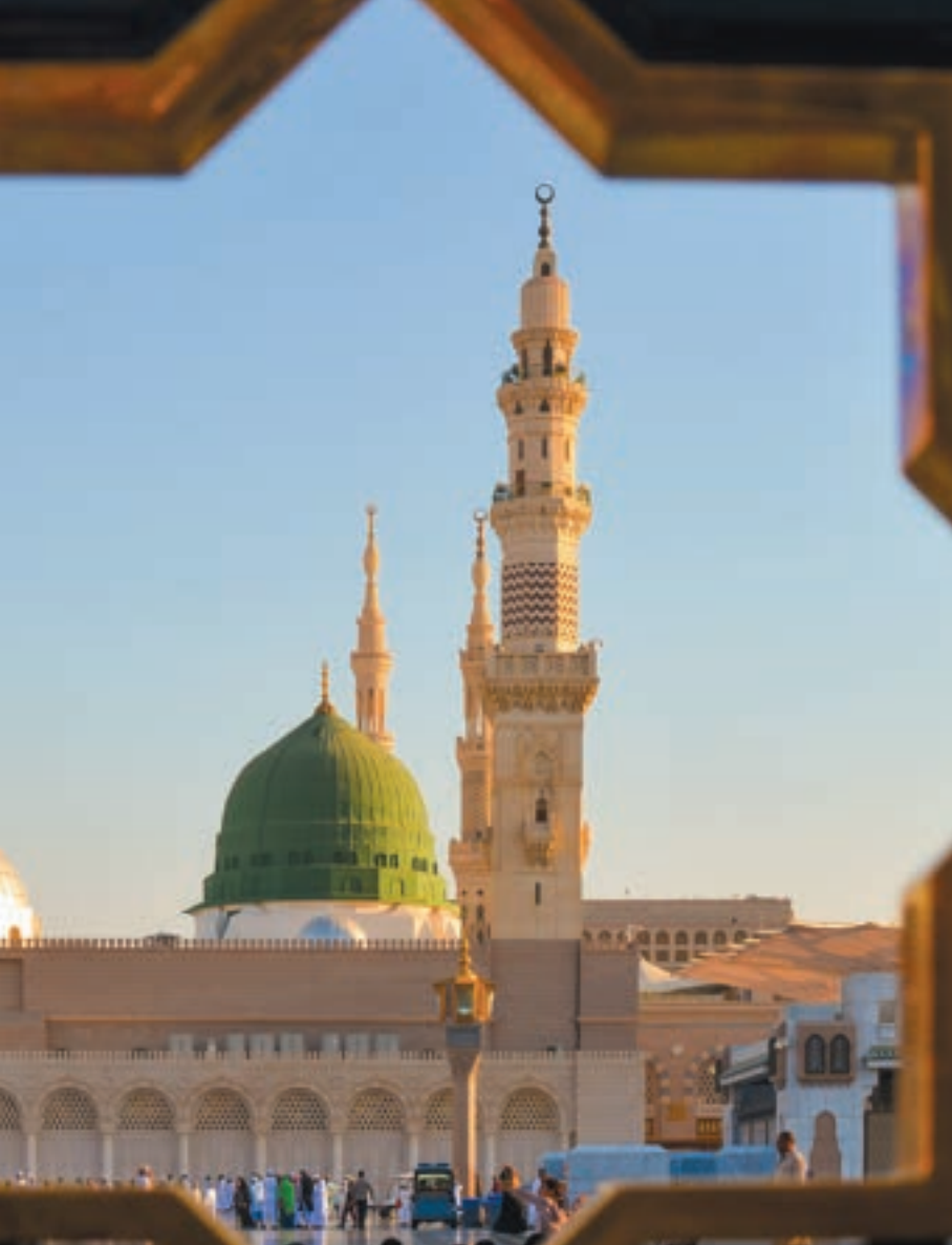
Mezquita del Profeta Muhammad | Medina, Arabia Saudita