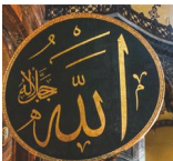
Аллаг арабською мовою

Мечеть (масджід). Чисте місце, яке мусульмани використовують для молитви та поклоніння.