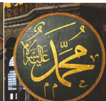
Мухаммад арабською мовою