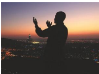
Мусульманин молить Аллага