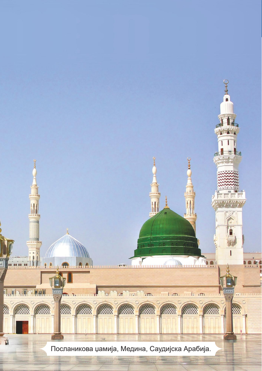
Посланикова џамија, Медина, Саудијска Арабија.