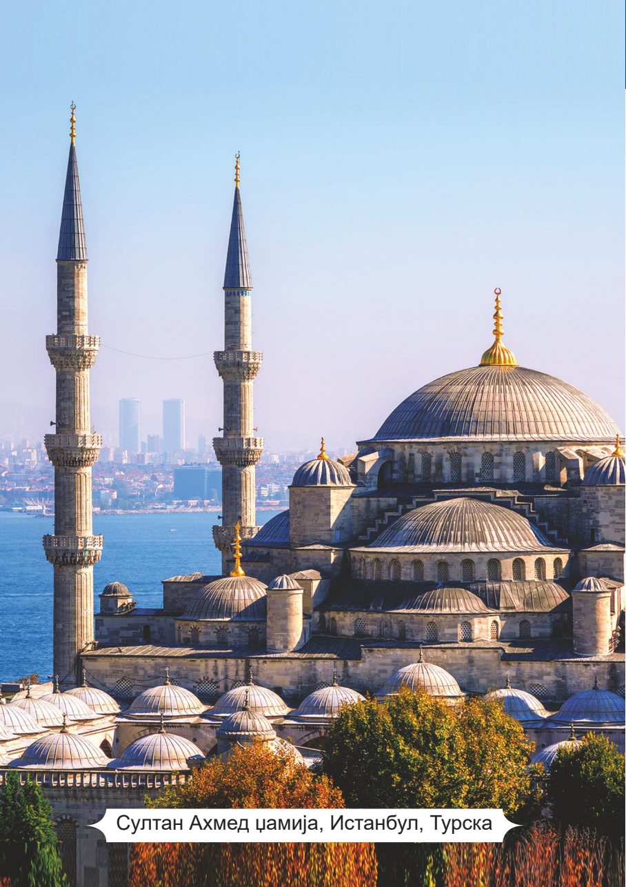
Султан Ахмед џамија, Истанбул, Турска