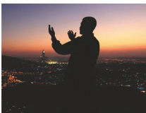
Муслиман се моли Аллаху