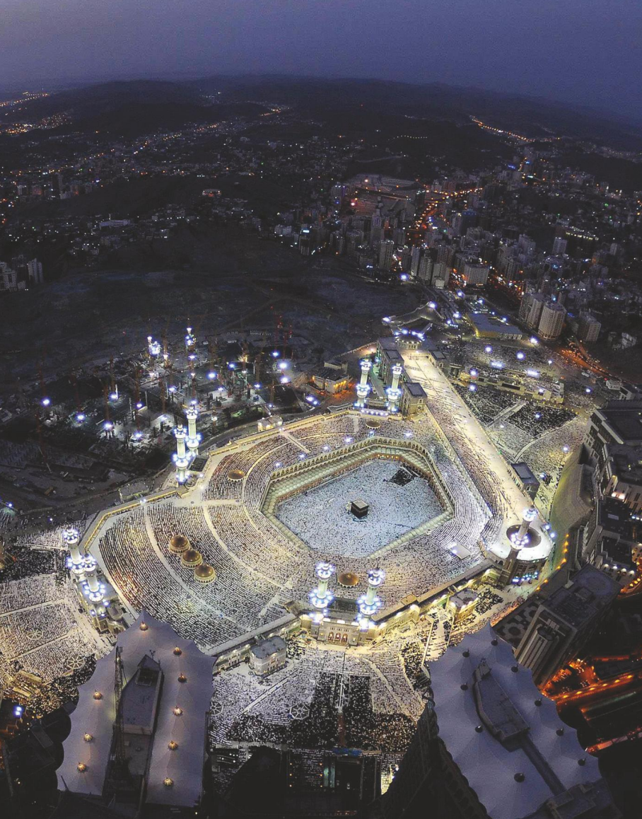
Света џамија, Мека, Саудијска Арабија.