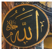
Аллах на арапском

Џамија: Чисто место за клањање које муслимани користе углавном за молитву и богослужење.