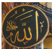
Аллах на арапском

Џамија: Чисто место за клањање које муслимани користе углавном за молитву и богослужење.